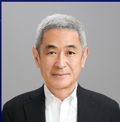
慶應義塾大学SFC研究所 上席所員